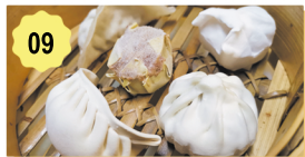
09 À la vapeur mixte Mixed steamed 6.80€