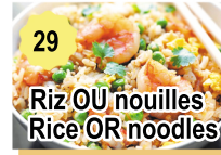
29 Riz OU nouilles Rice OR noodles