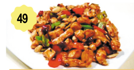
49 Poulet gong bao Chicken gong bao 12.00€