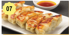
07 Ravioli frit Fried dumpling 5.80€