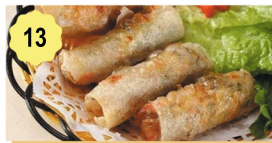
13 Croquettes vietnamiennes (nems) Vietnamiennes spring rolls 5.50€