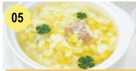
05 Potage aux crabe et maïs Crab and corn soup 4.80€