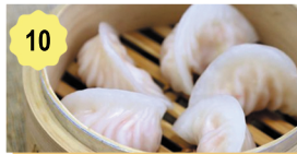
10 Ha kao (langoustines) Ha kao (shrimps) 5.80€