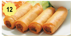
12 Croquettes thai (végétarien) Thai soring roll (vegetarian) 4.80€