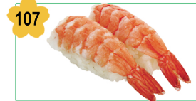
107 Sushi crevette Sushi shrimp (6 pcs) 8.50€