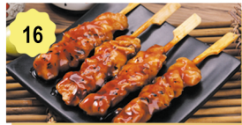
16 Brochettes de poulet (4 pcs) Chicken skewers (4 pcs) 5.80€