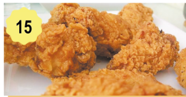
15 Ailes de poulet (6pcs) Chicken wings (6pcs) 6.80€