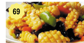
69 Calamars (gingembre+oignons verts) Squid (ginger+green onions) 12.00€