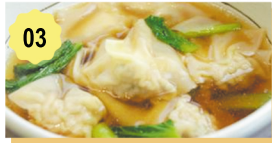
03 Potage wan tan Wan tan soup 4.80€