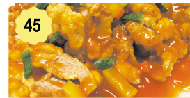
45 Poulet sauce aigre-douce Chicken sweet and sour sauce 12.00€