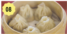
08 Petit pain à la vapeur (porcs) Stuffed bread roll (pork) 5.80€