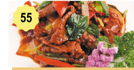
55 Boeuf sauté au basilic Beef with basil 12.80€