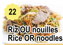
22 Riz OU nouilles Rice OR noodles