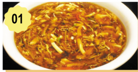
01 Potage oriental piquant Spicy oriental soup 4.00€