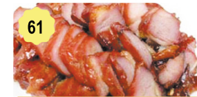
61 Porc laqué au miel Roasted pork with honey 13.80€