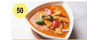
50 Poulet thai piquant au basilic Spicy thai chicken with basil 12.00€