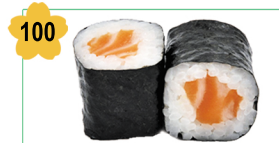
100 Saumon Salmon (8 pcs) 5.00€