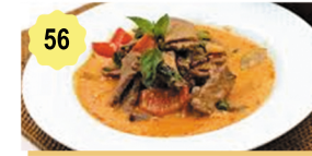
56 Boeuf sauce curry thai Beef in thai curry sauce 12.80€