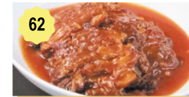
62 Babi bangang Babi bangang 13.80€