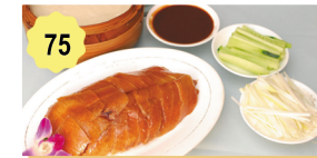
75 Canard laqué Pékin Peking duck 14.50€