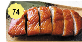
74 Canard croustillant Crispy duck 12.50€