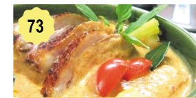
73 Canard sauce curry thai Duck in thai curry sauce 14.50€