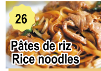
26 Pâtes de riz Rice noodles