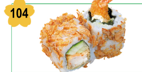
104 Tempura, concombre, oignon frit Tempura, cucumber, fried onion (8 pcs) 6.00€