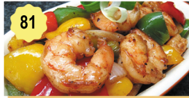
81 Scampis à l'ail Prawns with garlic 13.50€