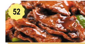
52 Boeuf Tié Pan Beef Tie Pan 12.80€