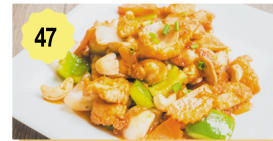
47 Poulet sauté aux noix de cajou Chicken with cashew nuts 12.80€