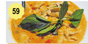
59 Porc sauce curry thai Pork in thai curry sauce 12.00€