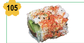
105 Saumon spicy, avocat, concombre Salmon spicy, avocado, cucumber (8 pcs) 6.00€