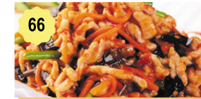
66 Porc sauté à la sauce "Yu Xiang" Pork "Yu Xiang" sauce 12.80€