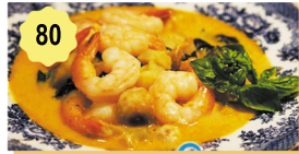
80 Scampis sauce piquant thai Prawns spicy thai sauce 13.50€