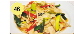
46 Poulet aux gingembre et à la ciboulette Chicken with ginger and chives 12.80€