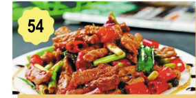
54 Boeuf sichuan (piquant) Beef sichuan (spicy) 12.80€