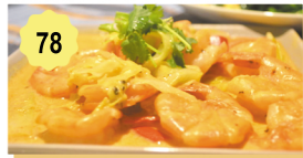
78 Scampis sauce curry thai Prawns in thai curry sauce 13.50€