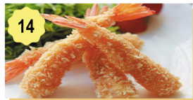
14 Scampi frit japonaise Fried shrimp japanese 5.50€