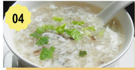
04 Crème aux nids d'hirondelles Swallow's Nest cream 4.50€