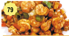
79 Scampis aux gong bao Prawns gong bao 13.50€