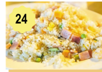
24 Riz sautés cantonnais Cantonese fried rice 10.00€