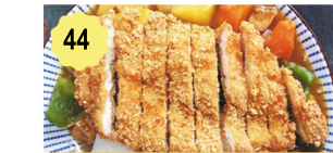
44 Poulet frit au curry Fried chicken curry 12.00€