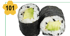
101 Concombre Cucumber (8 pcs) 3.80€