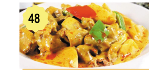
48 Poulet sauce curry thai Chicken in thai curry sauce 12.00€