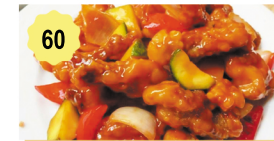
60 Beignets de porc sauce aigre-doux Fritter pork in sweet-sour sauce 11.80€