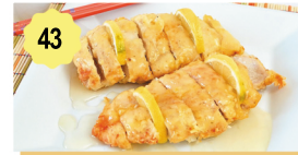
43 Poulet croustillant sauce citronnée Crispy chicken with lemon sauce 12.00€