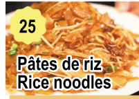
25 Pâtes de riz Rice noodles