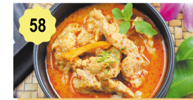
58 Porc thai piquant au basilic Spicy thai pork with basil 12.00€