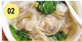
02 Soupe ravioli aux scampi Ravioli soup with prawns 6.50€