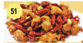
51 Poulet (très piquant) Chicken (spicy) 12.80€