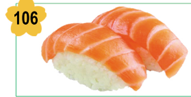
106 Sushi saumon Salmon sushi (6 pcs) 8.50€